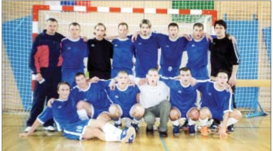
Jesenski prvaki zahodnega dela II. slovenske lige malega nogometa - ekipa KMN Nazarje

Spomladanski del prvenstva se prične že 31. januarja, ko v Nazarje prihaja drugouvrščena ekipa Poni Okrepčevalnica Corral iz Nove Gorice in rezultat tega derbija bo že o marsičem odločal. Po izkušnjah v tej sezoni »graščaki« doma ne izgubljajo (o tem se je lahko prepričala tudi državna repre-