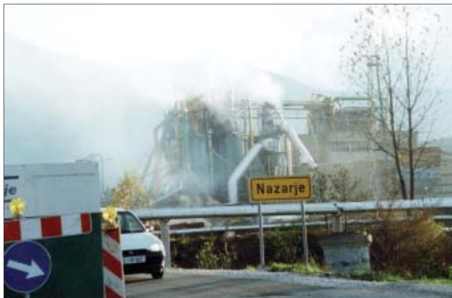
V tovarni ivernih plošč trdijo, da okolja ne onesnažujejo prekomerno, mnogi Nazarčani pa menijo ravno nasprotno

stalno nadzirajo, v podjetju pa se ravna po predpisih. »V Civilni iniciativi so izjavili, da so razočarani nad inšpekcijskimi službami, jaz pa moram reči, da inšpektorji naše